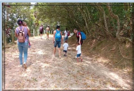
Estudo do meio no Parque Estoril