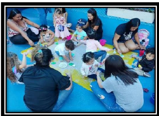
Interação mãe e filhos