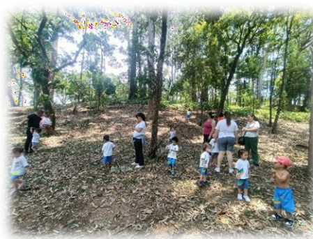
Estudo do meio