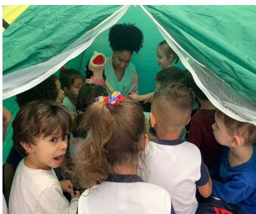
Brincadeira de cabana