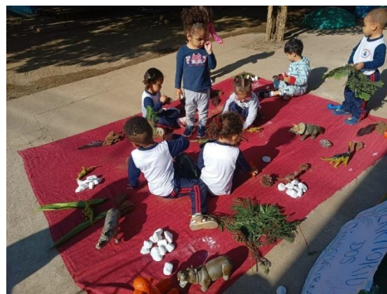
Brincadeiras no Parque

Endereço: Rua Renato Barbosa 213, Vila Conceição CEP 09911- 410 Diadema / SP