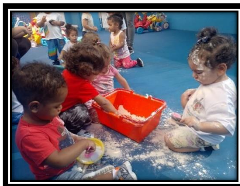
Exploração com material não estruturado

Endereço: Rua Tiradentes nº 398, Bairro Santa Terezinha, São Bernardo do Campo / SP