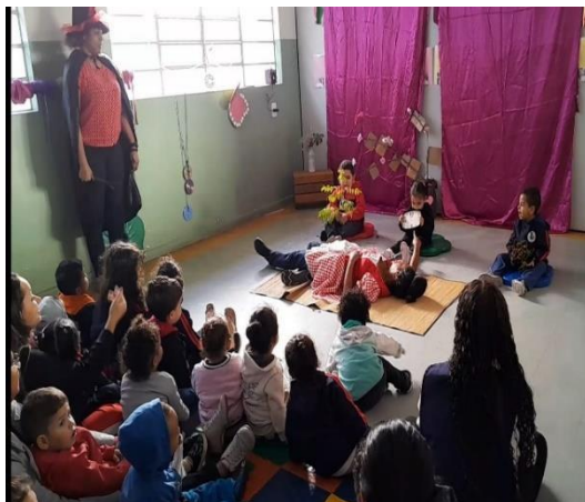
Contação de História

Endereço: Rua Independência, 98 – Parque Sete de Setembro, CEP 09910-150 Diadema / SP