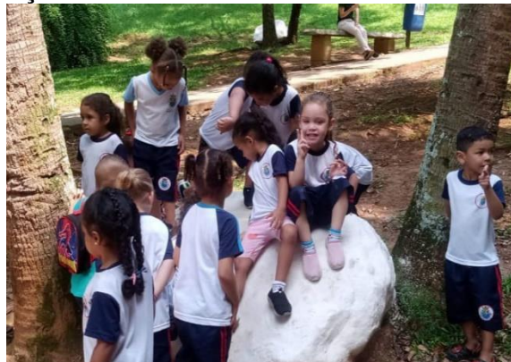
Passeio no Parque Borboletário

Endereço: Rua Idealópolis nº 295, Piraporinha CEP 09950-580 Diadema / SP