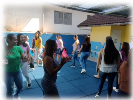
Formação com a equipe