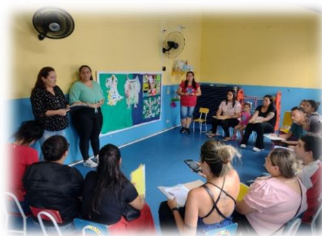
Reunião com pais

Endereço: Rua Benedito Luiz Rodrigues nº 864, Bairro Nova Petrópolis, São Bernardo do Campo / SP.