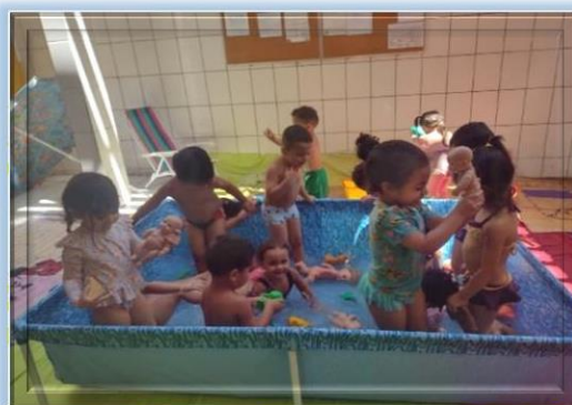
Brincadeiras com água

Endereço: Rua Camargo nº 184, bairro Paulicéia, São Bernardo do Campo / SP