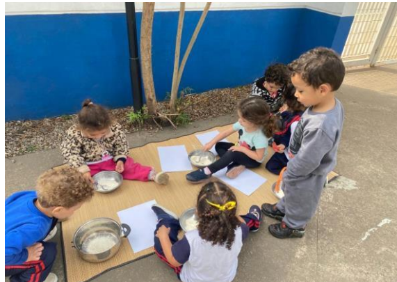
Exploração e vivências de artes