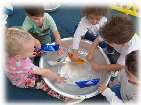
Exploração com água