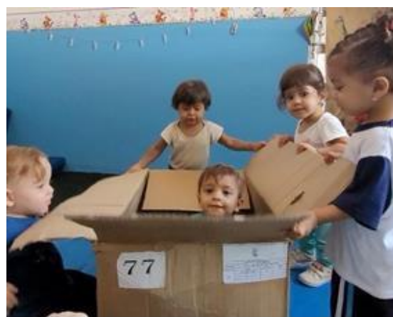
Brincadeira de faz de conta

Endereço: Rua Salgado de Castro 58, CEP 09920-690 Diadema / SP